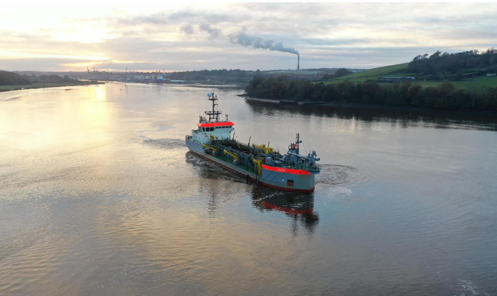
Sleephopperzuiger Lesse in Waterford - 2020