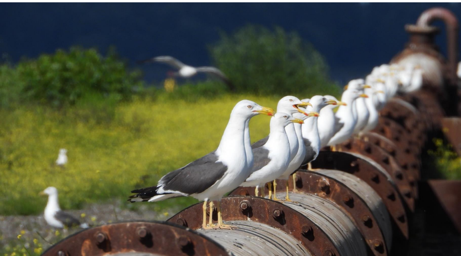
Meeuwen op het Baggerdepot Hollandsch Diep